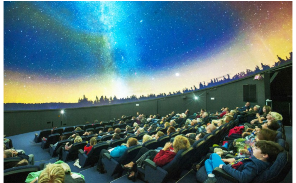
Découverte du Planétarium.

Années scolaires : 2018-2019 et 2019-2020